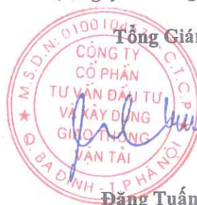
Đặng Tuấn Cường