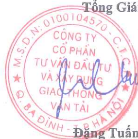
Đặng Tuấn Cường